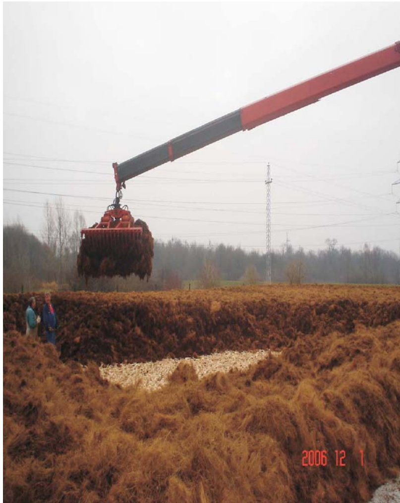
Slika 2: Izgradnja bio-filtera

Izgradnja bio-filtera prikazana je na slici 2.